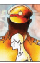
एक्ट्रोसिटी एक्ट का मामला हुआ दर्ज