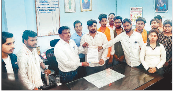
परीक्षा नियंत्रक को ज्ञान सौंपते छात्र प्रतिनिधिमंडल के सदस्य।

बिलासपुर। अटल यूनिवर्सिटी के खिलाफ गुरुवार को छात्र संगठनों ने मोर्चा खोल दिया। अखिल भारतीय विद्यार्थी परिषद द्वारा परीक्षा परिणामों में गड़बड़ी को लेकर परीक्षा नियंत्रक को घेरा गया। वहीं एनएसयूआई का प्रतिनिधिमंडल अनियमितताओं को लेकर कुलपति से मिला। दूसरी तरफ यूटीडी के छात्रों ने यूनिवर्सिटी में गंगाजल छिड़ककर अनास्था प्रदर्शन किया। इस तरह तीन छात्र संगठनों ने आज यूनिवर्सिटी पर हमला बोला।